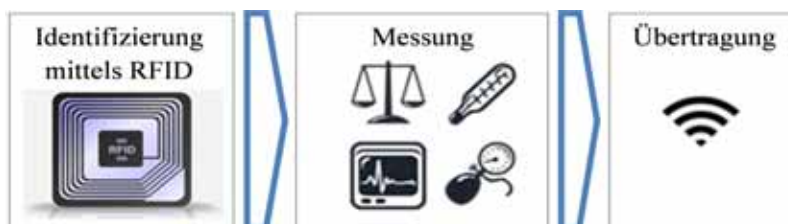
Abbildung 1: Messung von Vitaldaten

Die Messung von Vitaldaten erfolgt auf Basis des oben beschriebenen i-Residence Systems, das die Integration beliebiger Messgeräte erlaubt, im konkreten Anwendungsfall Messgeräte für Blutdruck, Blutzucker und Gewicht. Eine besondere Herausforderung stellen dabei die unterschiedlichen Patienten der Caritas dar – Patienten im Umfeld der mobilen Pflege sowie auch Bewohner des Sozialzentrums. Diese Tatsache wirkt sich v.a. auf die Nutzung der Messgeräte aus: Während im Umfeld der mobilen Pflege jedem Patienten ein eigenes Gerät zur Verfügung steht, nutzen im Sozialzentrum mehrere Personen gemeinsame Messgeräte. Hier stellt sich die Frage, wie bei gemeinsamer Nutzung ein Messwert dem jeweiligen Patienten zugeordnet werden kann. Im Zuge des Projektes wurde die gemeinsame Nutzung durch Identifikation mittels RFID-Tags realisiert (siehe Abbildung 1 ), die die Zuordnung einer Messung zu einem Patienten ermöglichen.