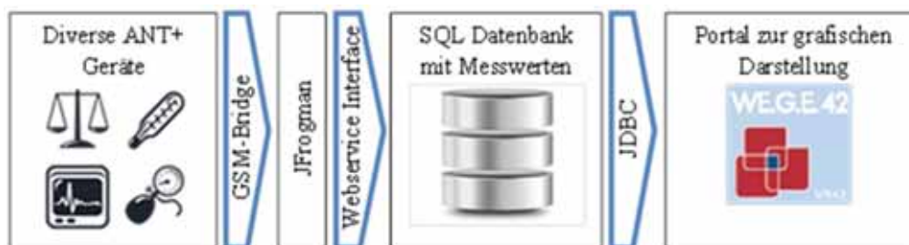
Abbildung 2: Proprietäre Übertragung von Vitaldaten in eine Datenbank (TeleMoniCare Architektur)

Im Projekt TeleMoniCare liegt der Fokus nicht auf der standardisierten Übertragung, sondern auf der Dienstleistungsentwicklung. Daher werden die Daten über proprietäre Schnittstellen in eine Datenbank übertragen und gespeichert. Die Messwerte werden im direkten Umfeld des Patienten mit Hilfe des ANT+-Protokolls an die Basisstation, die GSM-Bridge, übertragen. Dort werden sie in das JSON-Format (JavaScript Object Notation [3]) verpackt und über das GSM-Mobilfunknetz versandt (siehe Abbildung 2 ). Eine Middleware (JFrogman) verarbeitet die JSON-Nachricht und ruft ein Webservice auf, das die Messwerte in eine relationale Datenbank überträgt. Die Darstellung der Messwerte erfolgt über ein Telemedizin-Portal, das nach einer Test- und Pilotphase im Laufe des Projekts in die bestehende WE.G.E.42 Infrastruktur [13] eingebunden werden soll.